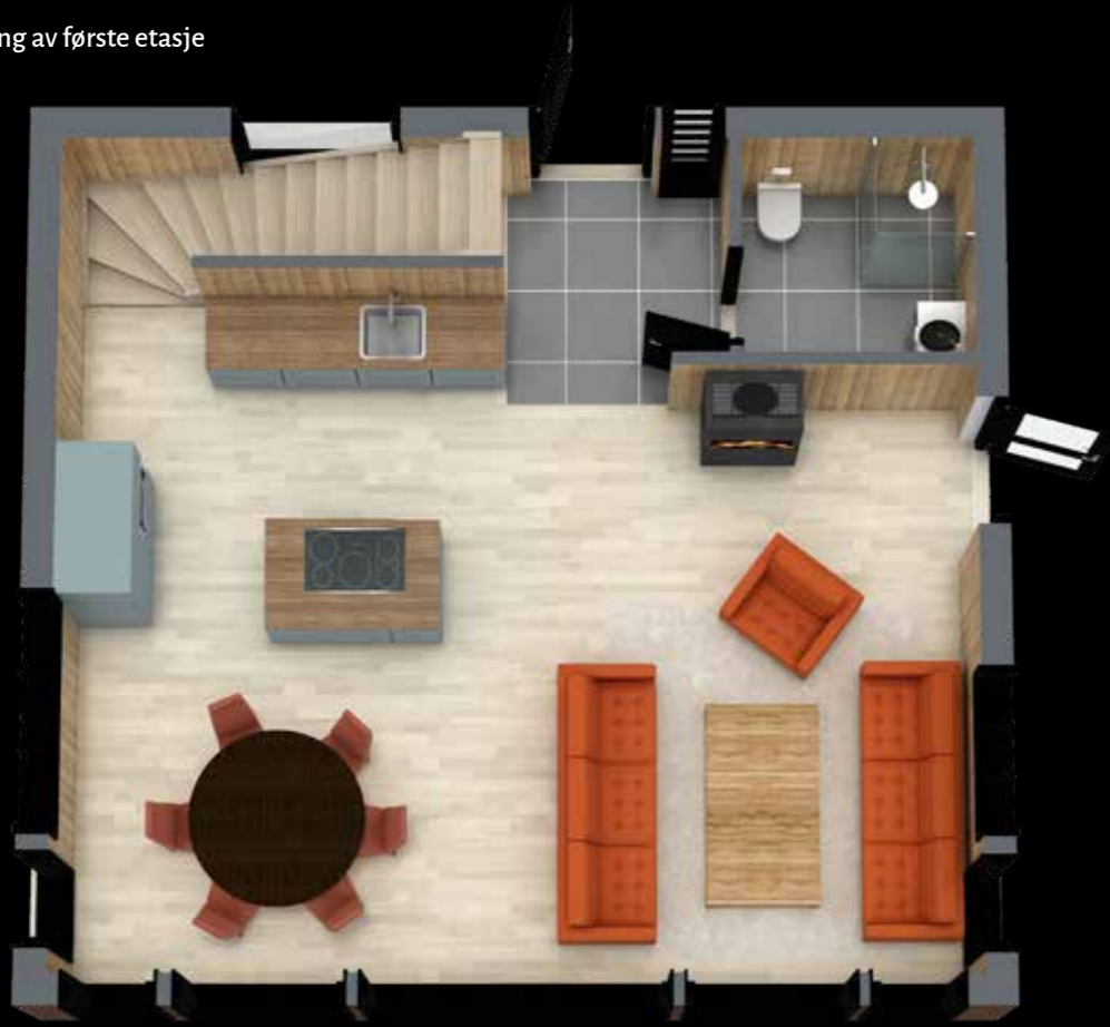
3D illustrasjonstegning av første etasje