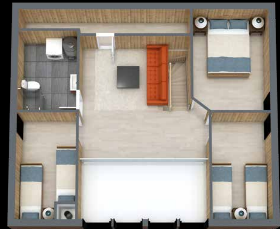
3D illustrasjonstegning av hemsetasje

Hemsetasje med romslig stue, tre soverom og bad. Hemsestuen er ofte benyttet som ekstra TV-stue, eller kontor. Her har du god oversikt ned til kjøkken og stue, samtidig som du får den flotte utsikten.