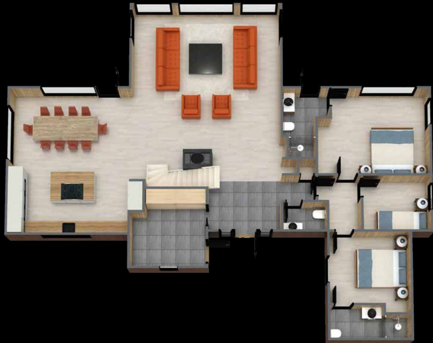
3D illustrasjonstegning av første etasje